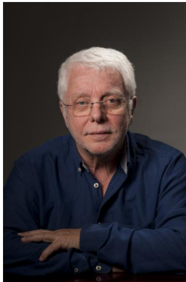
PROF. WOLFGANG HARTMANN

Obiettivo del suo lavoro è l'integrazione di persone con necessità particolari – diversamente abili o estremamente talentuosi – nel lavoro creativo di gruppo del "Music Drama – Elemental Style".